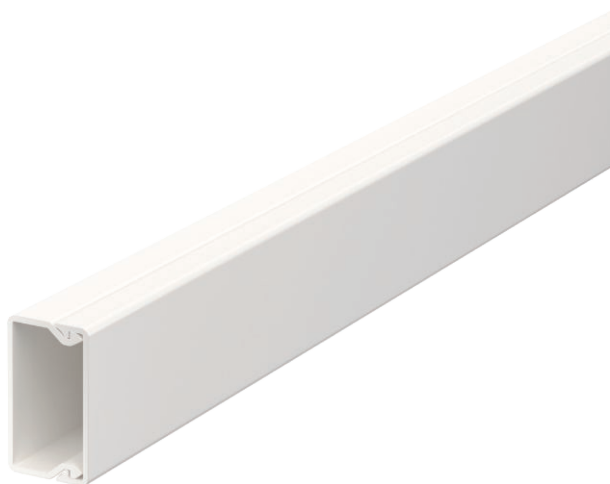
Tampa e base da calha.